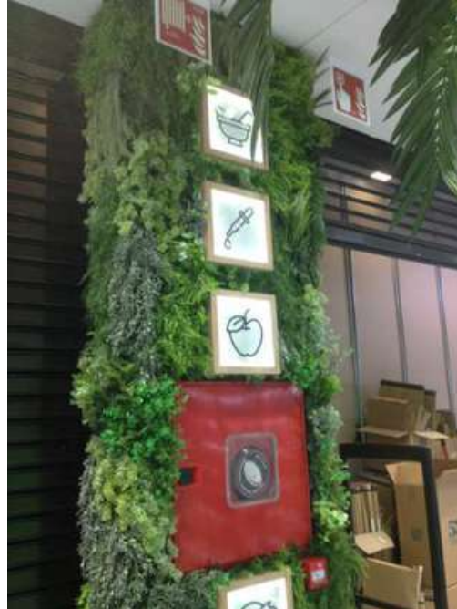
Instalación del Sistema de Protección Automática contra incendios en Primor