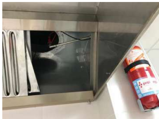
Instalación del Sistema de Protección Automática contra incendios en cocina Asador de Elda