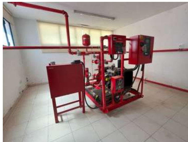
Instalación de todo el sistema de Protección contra incendios en Fábrica de Cartonajes en Elda