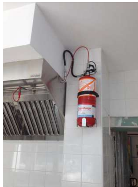
Instalación Sistema Extinción Automática en cocina de un colegio en Benidorm

En Profuego contamos con técnicos altamente cualificados y con un equipo de ingenieros, que nos permiten realizar todo tipo de instalaciones de Sistemas de Protección contra incendios.