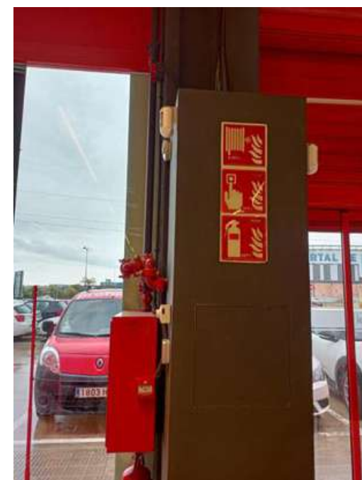
Instalación del Sistema de Protección Automática contra incendios en Tienda Kiwoko Ondara